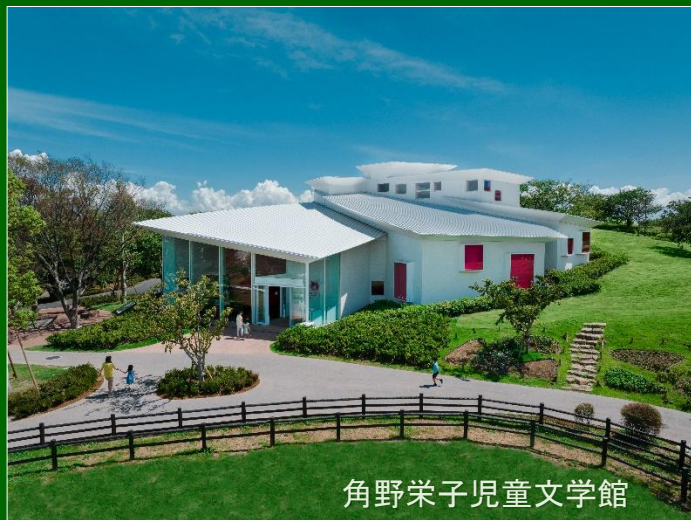
角野栄子児童文学館