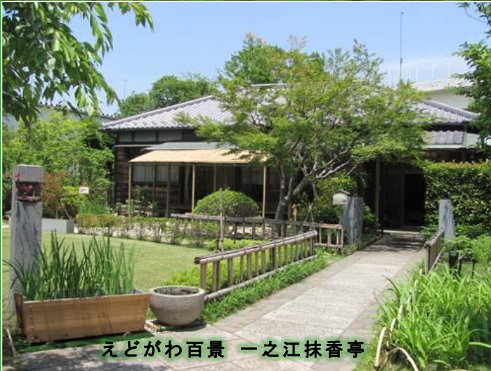
えどがわ百景 一之江抹香亭